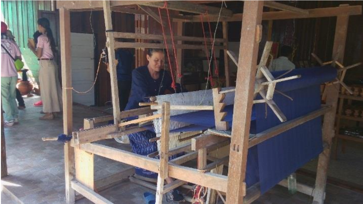
ภาพที่ 1.1 การทอผ้าของไทยพวน ชุมชนบ้านเชียง

สุพรรณบุรี, จังหวัดอุดรดิษฐ์, จังหวัดพิษณุโลก, จังหวัดพิจิตร, จังหวัดแพร่, จังหวัดสุโขทัย, จังหวัดหนองคาย และจังหวัดอุดรธานี และในปัจจุบันได้มีการเรียกชาวพวนกลุ่มนี้ว่า “ไทยพวน”