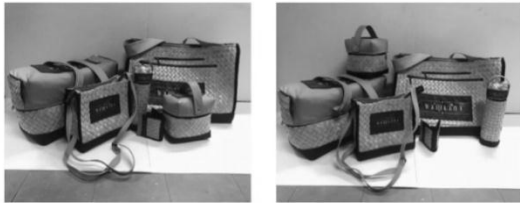
ภาพที่ 2 ผลิตภัณฑ์ที่สมบูรณ์แล้ว

การจำหน่ายจำนวนมาก ๆ นอกจากนี้อาจเหมาะสมกับวัสดุที่เลือกใช้ อยู่ในระดับมาก ซึ่งหมายถึงการใช้งานได้ตามวัตถุประสงค์