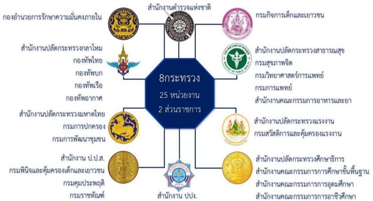
ภาพที่ 3 รายชื่อหน่วยงานมีงบประมาณด้านการแก้ไขปัญหายาเสพติด

การประชุมวิชาการระดับชาติ “การเรียนรู้ด้านมนุษยศาสตร์และด้านสังคมศาสตร์” ครั้งที่ 3 คณะมนุษยศาสตร์และสังคมศาสตร์ มหาวิทยาลัยราชภัฏสวนสุนันทา วันที่ 23 พฤศจิกายน 2562