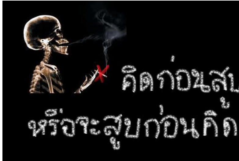
ภาพที่ 5.1: โปสเตอร์ : คิดก่อนสูบ หรือจะสูบก่อนคิด