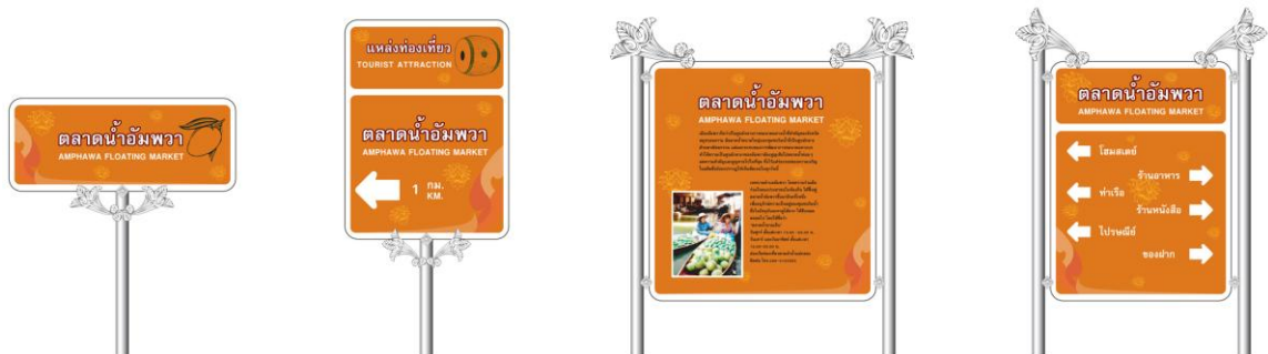
ภาพที่ 5.2 ตัวอย่างงานออกแบบป้ายสัญลักษณ์สำหรับการท่องเที่ยวของจังหวัดสมุทรสงคราม