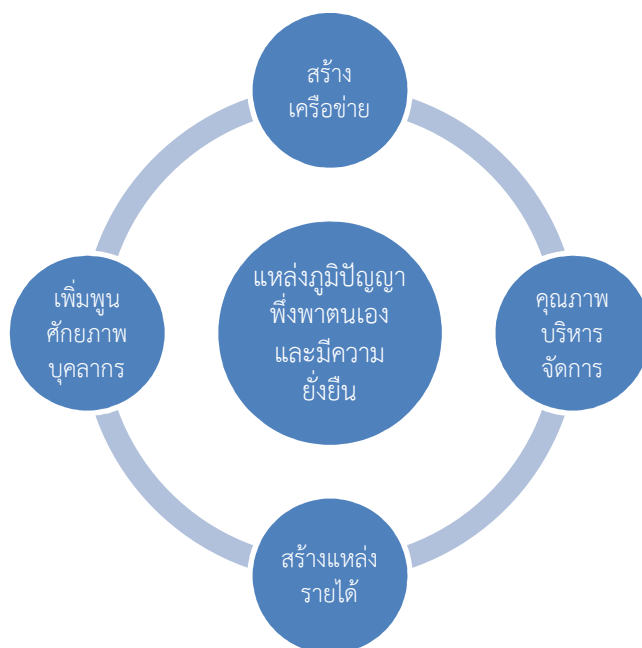
ภาพที่ 2.2 แผนยุทธศาสตร์ ระยะ 5 ปี (พ.ศ. 2560 – 2564)

เพื่อให้การดำเนินงานของศูนย์การศึกษามหาวิทยาลัยราชภัฏสวนสุนันทา จังหวัดระนอง เป็นไปอย่างมีประสิทธิภาพและบรรลุเป้าหมาย จึงได้พิจารณาแนวทางการกำหนดตัวบ่งชี้ความสำเร็จของการบรรลุยุทธศาสตร์ โดยนำแนวคิด Balanced Scorecard มาประยุกต์ใช้ ดังนี้