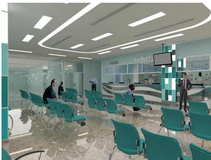
ภาพที่ 5.1 ตัวอย่างการออกแบบส่วนโถงพักคอย ภายในโรงพยาบาล โดยใช้สีโทนเย็น

จากผลการวิจัย คณะผู้วิจัยพบข้อสังเกตที่น่าสนใจ ในประเด็นความคิดเห็นที่มีความแตกต่างกันของกลุ่มนักร้องแบบ และกลุ่มผู้ป่วย ญาติผู้ป่วย ผู้ให้บริการ โดยกลุ่มนักร้องแบบส่วนใหญ่แสดงความคิดเห็นในทิศทางตรงข้ามกับกลุ่มอื่นๆ ด้านการใช้แสงและสีภายในพื้นที่ ที่นักร้องแบบให้ความสำคัญกับบรรยากาศมากกว่า ในขณะที่กลุ่มอื่นให้ความสำคัญกับการใช้งานที่สะดวกในการมองเห็นและการใช้งานมากกว่า และอีกประเด็นหนึ่งคือความรู้สึกต่อสไตส์ในการตกแต่ง นักร้องแบบให้ความสนใจกับความรู้สึกตื่นเต้น เร้าใจและเป็นแบบสมัยใหม่ ในขณะที่กลุ่มอื่นๆ ให้ความสนใจกับความรู้สึกผ่อนคลายมากกว่า ดังนั้นความแตกต่างนี้สามารถชี้ให้เห็นถึงการรับรู้ด้านความรู้สึกของผู้ที่เป็นนักร้องแบบ กับผู้ที่ไม่ได้เป็นนักร้องแบบมีความแตกต่างกันบ้างในบางประเด็น นักร้องแบบจึงควรคำนึงถึงการรับรู้ของผู้ใช้งานพื้นที่เป็นปัจจัยสำคัญ และไม่ใช้ความรู้สึกส่วนตัวของนักร้องแบบเองในการออกแบบสภาพแวดล้อม ซึ่งสอดคล้องกับสมมติฐานของการวิจัยนี้