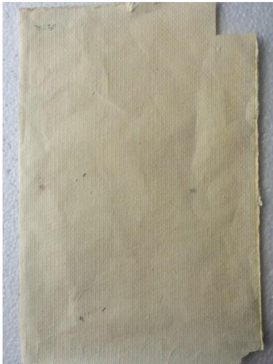
ภาพที่ A5 กระดาษอัตราผสมระหว่างกกและดาวเรือง 70 ต่อ 30