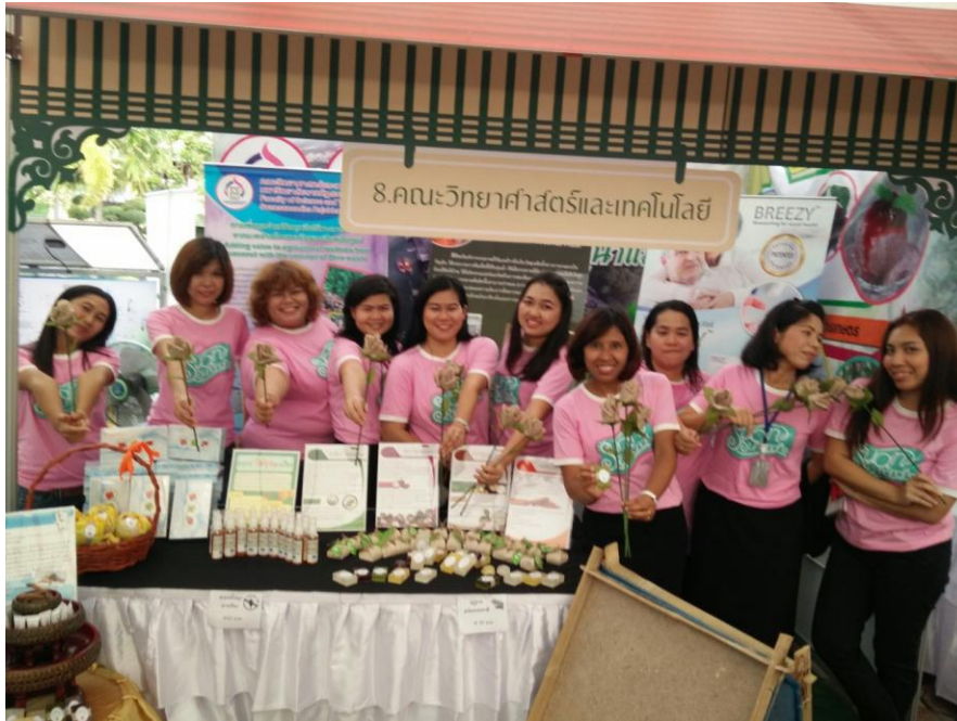
ภาพที่ A2 งานสุนันทาวิชาการ 2559