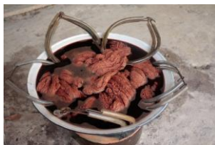
ภาพที่ A3 สีย้อมที่เหลือจากการย้อมผ้าด้วยสีธรรมชาติ และสีย้อมทางเคมี