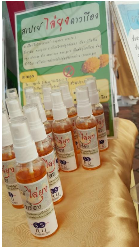
ภาพที่ A1 ผลิตภัณฑ์ไล่ยุงจากดาวเรือง